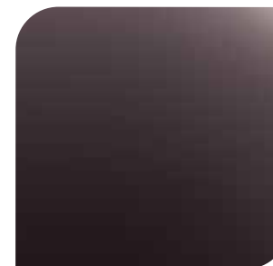
Ametista Scura 1 600,- lakier metalizowany specjalny