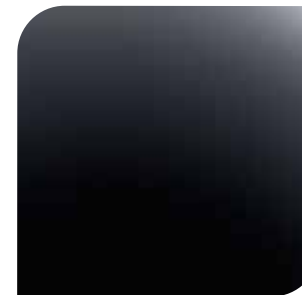
Mica Shadow Black bez dopłaty lakier specjalny